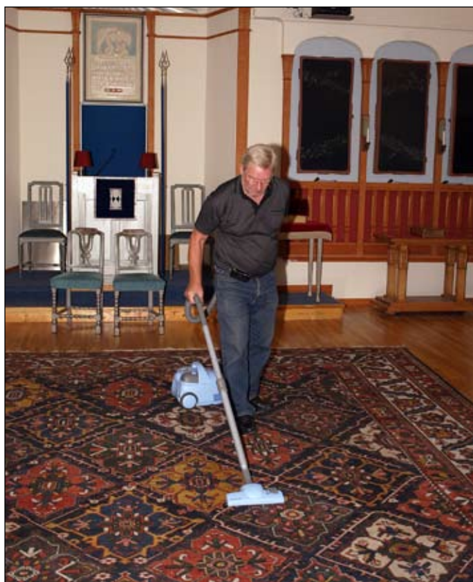
Idrisbroder Folke Brand dammsuger

AB Knuten är ägare av fastigheten Kyrkogatan 4 där Logen Idris hyr lokal tillsammans med Rebeckalogen, Frimurarna och Odd Fellow. Europaskolan hyr lokaler där skolan bedriver gymnasieundervisning som friskola.