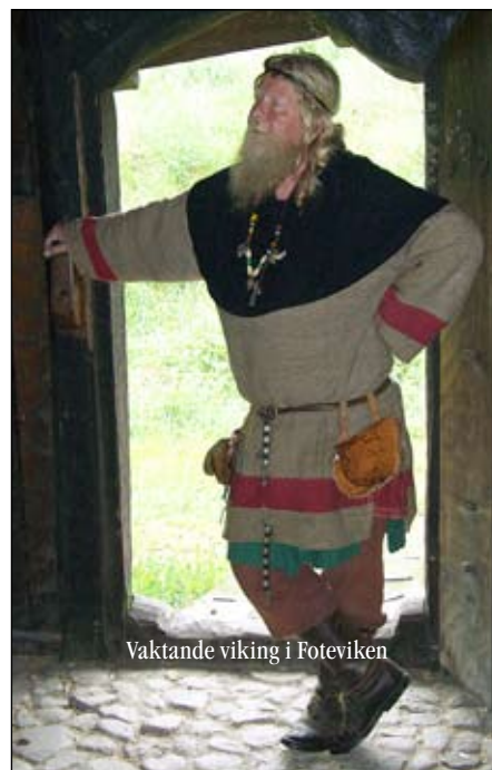
Vaktande viking i Foteviken