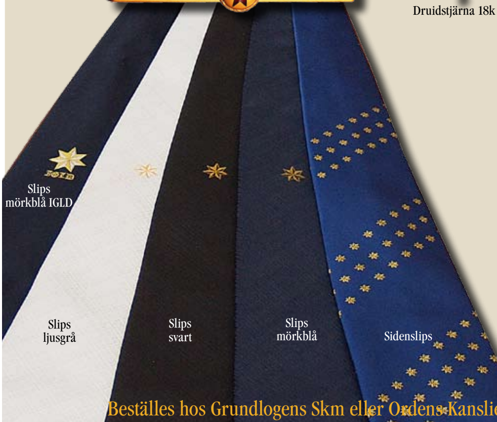
Slips mörkblå IGLD