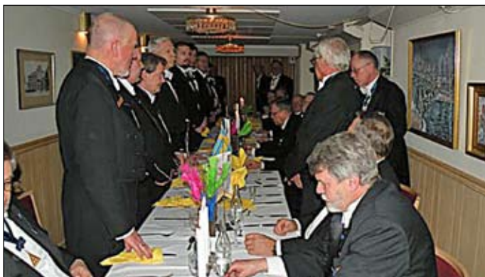
SÄÄ's tal till recipienderna.