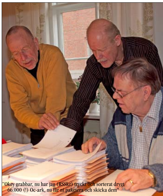
"Okey grabbar, nu har jag (RSSkr) tryckt och sorterat drygt 66.000 (!) Oc-ark, nu får ni paketera och skicka dem"