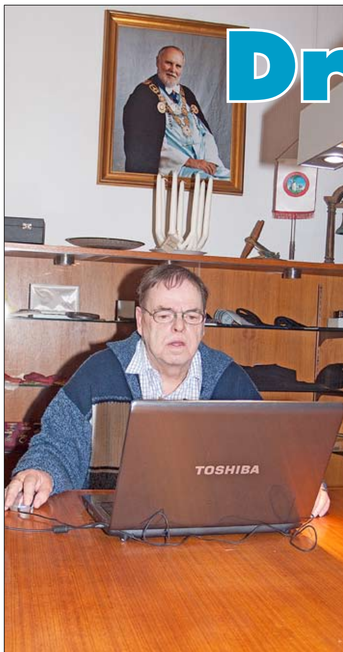
RSSkr skriver de nya Ordenscirkulären (och RSÄÄ övervakar...)

När jag i somras fick frågan om jag ville biträda RSV i hans uppgifter på ordenskansliet, tvekade jag bara någon sekund - kan vara trevlig att som nybliven pensionär ha kansliet som mål för en stärkande promenad någon dag i månaden. För mer är så behövs man väl inte där, trodde jag. Men oj vad fel jag hade! Det är full rulle alla dagar i veckan. Berätta sa Svensk Druid-Tidning.