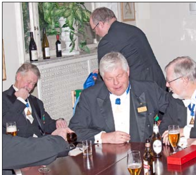
Gästande bröder från logen Beltain i Östhammar

Gustavianum samt Silverbibeln på universitetsbiblioteket Carolina Rediviva.