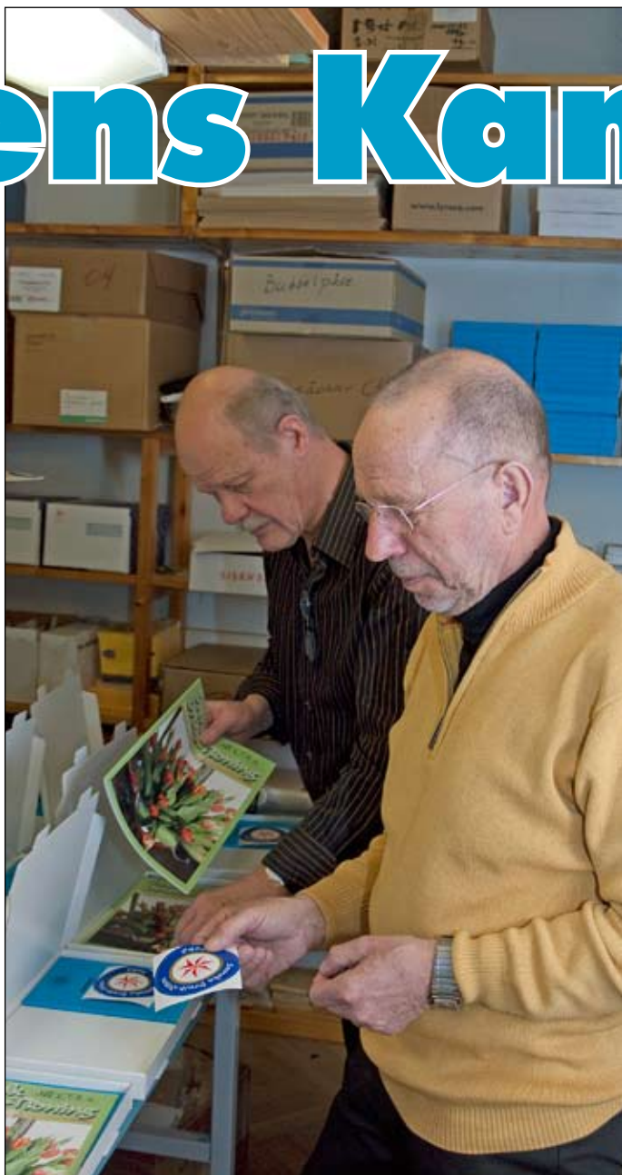
RSV (t h) och hans biträde plockar samman recipiendpaket

åren! Och jag lovar, han har fullt upp hela tiden som den administrativa spindel han är i vårt Ordensnät.